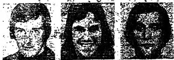
بيير شيلتون، غراهام تايلور، كولين تود